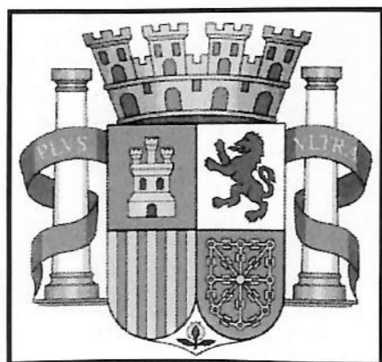
Publicación en Gaceta de la República N° 26 26-01-1938, Ministerio de la Gobernación

Por acuerdo del consejo Municipal de Requena (Valencia) con fecha 19 de Agosto de 1937, fue aprobado el expediente de segregación de la aldea denominada anteriormente San Antonio, hoy Vegalibre, a fin de constituirse en Municipio independiente asignándole como término municipal la demarcación que correspondía a la antigua parroquia de San Antonio, limitando al Norte con el de Chelva, Sur y Este con el de Requena, y Oeste con el de Utiel.