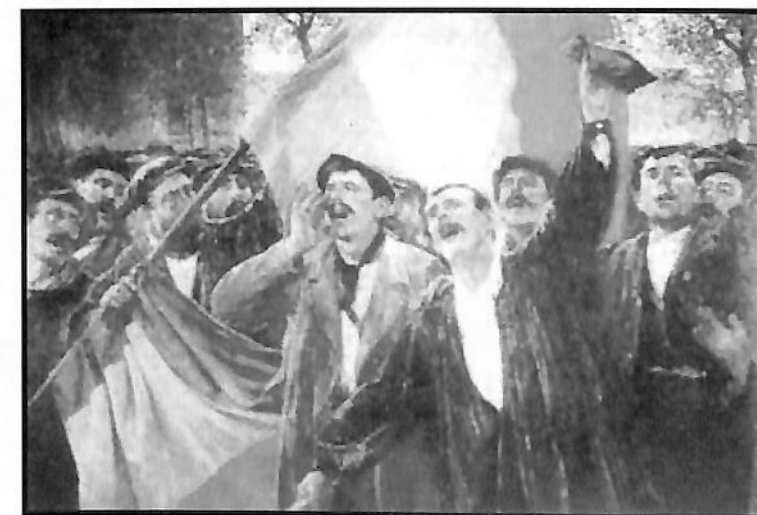
El 16 de Febrero de 1936, el frente popular, formado por la unión de los partidos de izquierdas ganan las elecciones democráticas.