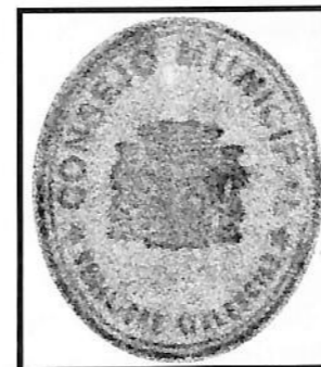
Sello Municipal Vegalibre

Libro de Actas de las sesiones celebradas en el Consejo Municipal de Vegalibre 1938. Acta de Constitución de este Consejo Municipal Vegalibre, 21-02-1938.